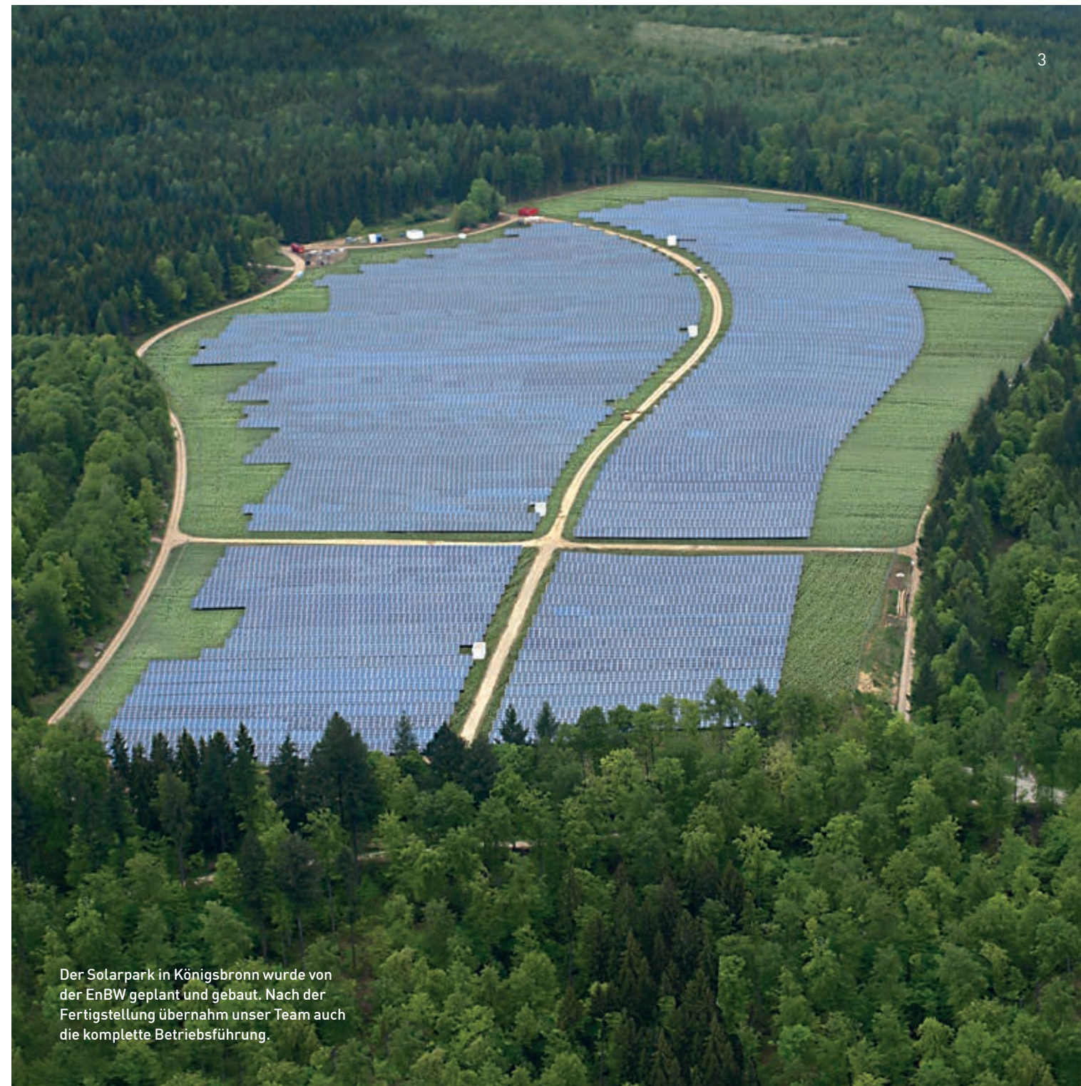
Der Solarpark in Königsbrunn wurde von der EnBW geplant und gebaut. Nach der Fertigstellung übernahm unser Team auch die komplette Betriebsführung.

Nutzen Sie die Chance, sich effektiv zu entlasten – und die Potenziale Ihrer Anlage gleichzeitig bestmöglich auszuschöpfen!